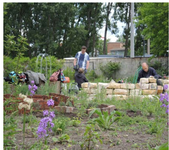
Garten und Trockenmauer