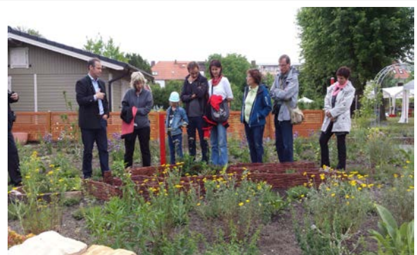
Führung durch den Wildbienen-Schaugarten in Treptow am „Langen Tag der Stadtnatur“