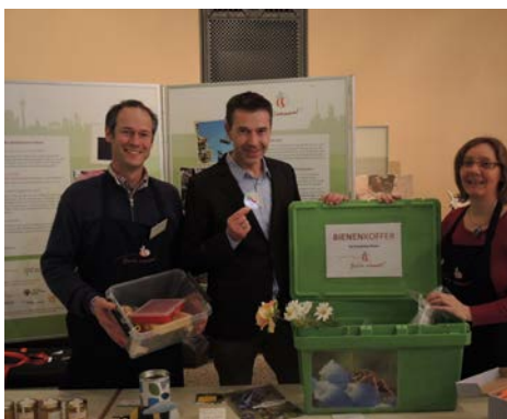
Fernseh-Moderator Dirk Steffens zu Besuch

Mit Info- und Mitmachständen präsentierte die Initiative ihr Anliegen auf der Grünen Woche Berlin, anlässlich des Tages des Artenschutzes im Naturkundemuseum, auf dem Staudenmarkt im Botanischen Garten Berlin-Dahlem, beim Tag der offenen Tür im Bundeskanzleramt und bei einem Bientag in den Gropius Passagen. Mit einem speziellen Bienenkoffer-Infostand war Berlin summt! beim 3. Schulgartentag in der Gartenarbeitsschule Ilse Demme vertreten. Die Wanderausstellung „Honigbienen und ihre wilden Verwandten“ wurde im Foyer der Mensa HU Nord und in den Spandau Arcaden gezeigt.