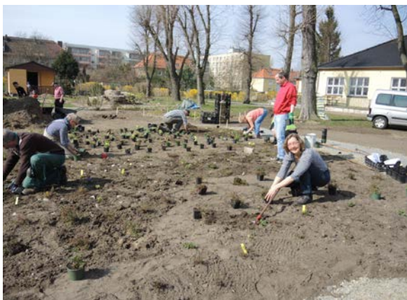
Pflanzen der heimischen bienenfreundlichen Stauden und Gehölze