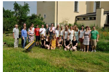
Vertreter der Universität, der Verbände, Vereine, die Landtagsabgeordneten, der Oberbürgermeister, Lehrer und Studenten