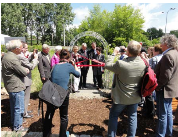
Einweihung am 20.06.2015