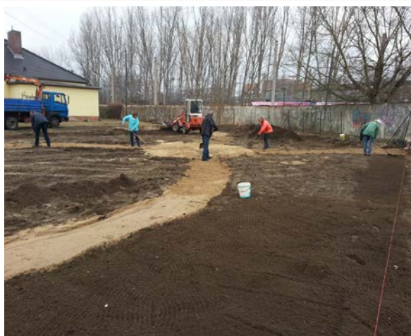
Abschieben des Oberbodens, Wegebau, Januar 2015