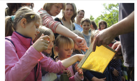
Hannover summt! auf dem Frühlingsfest im Kinderwald

Wie schon im vergangenen Jahr nahm Hannover summt! wieder mit einem Infostand und Kinderaktionen am Frühlingsfest im Kinderwald teil. Zudem präsentierte sich die Initiative beim Tag der Artenvielfalt im Naturfreundehaus Hannover. Großen Anklang fand eine Vorführung der neuartigen Bienensauna, eine alternative Behandlungsmöglichkeit gegen die Varroa-Milben.