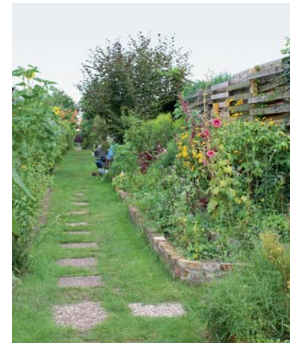
In Gemeinschaftsarbeit entstand in kurzer Zeit aus dem mit Gestrüpp überwucherten Hang ein Insektenparadies, das thematisch mit heimischen Stauden, Wildpflanzen und Kräutern bepflanzt wurde. Der neu gestaltete Querweg lädt zum Schauen und Staunen ein.