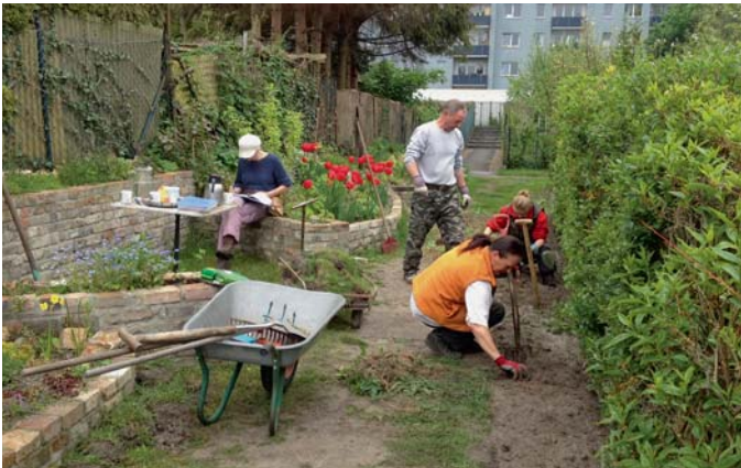
Rund 30 Gartenfreunde arbeiteten am Projekt mit.